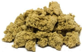
Étoupe de moxa (vrac) dans des boites, ou sur du gingembre (thérapie du nombril)