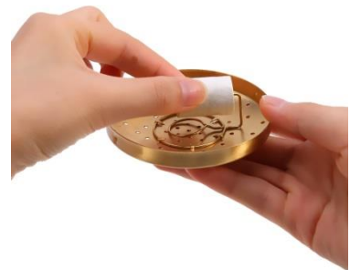
En bâton, dans des boites à Moxa